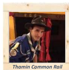
Thamin Common Rail

Lors des travaux, nous avons trouvé des vestiges du passé. Des vieux bois, des pourritures, des francs, un vieux paquet de cigarettes, des pneus neufs et des barres de voiture, une Jupiler datant de 1997 ! Nous avons donc décidé avec Addax de laisser, à notre tour, une trace dans le coin des Castors en espérant qu'un jour nos successeurs puissent nous contacter.